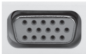
Mini D-sub 15 ピン端子形状